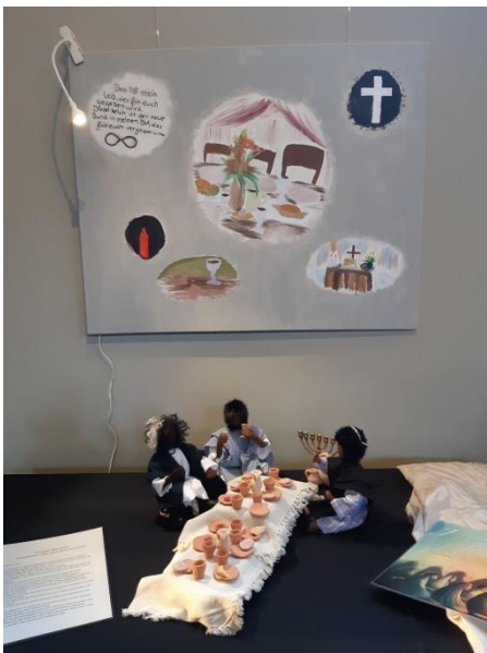
Das Letzte Abendmahl