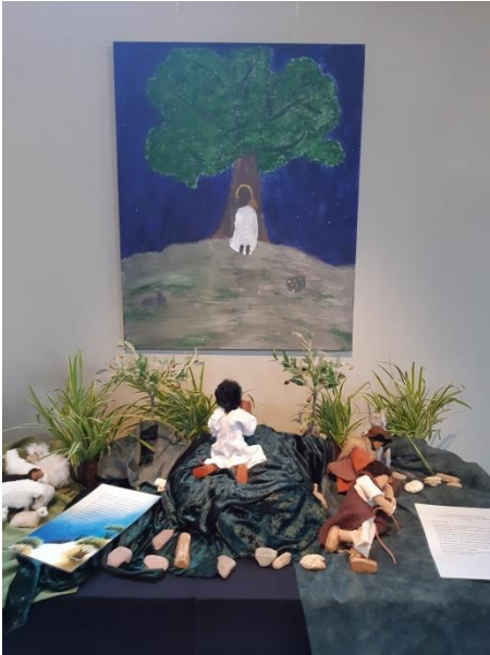
Jesus betet auf dem Ölberg