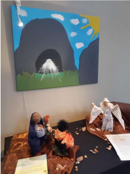
Ostermorgen: Das Grab ist leer!