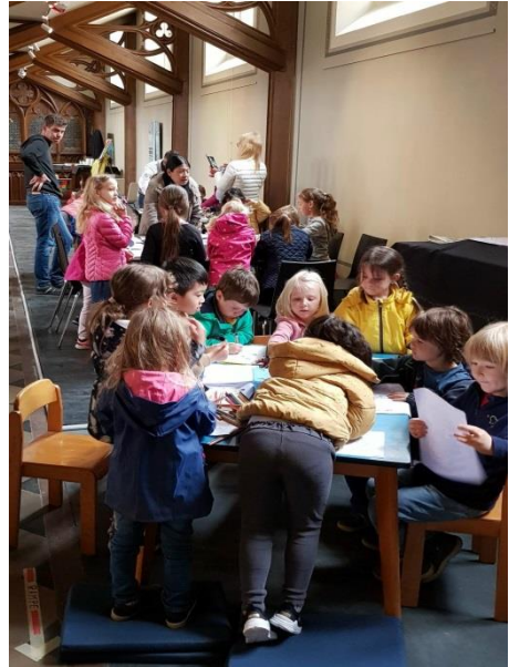
Die Kita-Kinder beim Malen