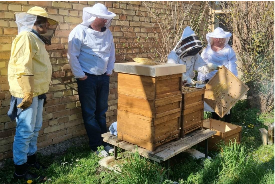
Informative Einführung der „Neuen“ durch unsere Imkerin aus dem Ältestenkreis