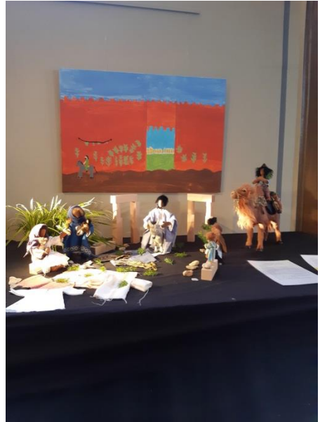
Jesu Einzug in Jerusalem