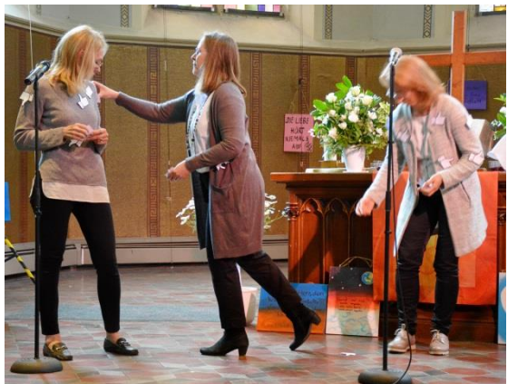
Anspiel der Konfieltern über "Likes" und "Dislikes"

Am Vorabendgottesdienst mit Abendmahl wirkten viele Eltern mit: bei den Gebeten und beim Anspiel über ein Mädchen, von dem alle Bewertungspunkte der anderen abfallen, weil es im Kontakt mit dem Schöpfer steht und wunderbar gemacht ist – egal, was andere sagen und denken. Bei der Musik gab es einen sehr emotionalen Moment, als die Eltern als stimmkräftiger und guter Chor im Altarraum das schöne Lied „Vergiss es nie“ (NL 201) darbrachten und damit ihren Kindern zusangen