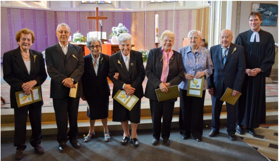
Die Jubilarinnen und Jubilare mit 75-jährigem Konfirmationsjubiläum

58 Gemeindeglieder feierten am 21. Mai den 50., 60., 65., 70. und gar 75. Jahrestag ihrer Konfirmation. Oder aber eine Jahreszahl dazwischen, weil die letzten drei Jahre davor die Konfirmationsjubiläen wegen Corona ausgefallen waren und im Aufruf auch die Möglichkeit angeboten wurde, diese Feiern entsprechend nachzuholen.