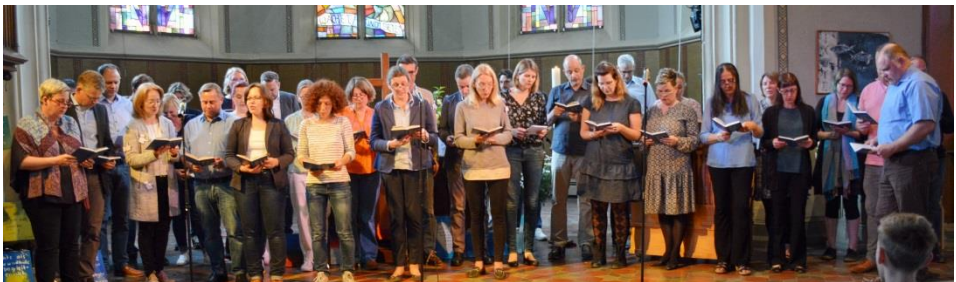
Chor der Eltern beim Vorabendgottesdienst

Der neue Konfi-Jahrgang startet kurz vor den Sommerferien mit einem Kennenlernabend und dann regulär nach den Sommerferien. Bis dahin sind noch Anmeldungen möglich.