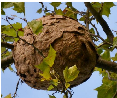
Sekundärnest in Seckenheim, Oktober 2023

Im Frühjahr baut eine Königin ein sogenanntes Primärnest in einer geschützten Behausung oder auch an einer niedrigen Hecke. Im Sommer zieht die nun bereits recht große Kolonie um und baut ein Sekundärnest, das in der Regel frei hoch in einer Baumkrone hängt und zum Herbst einen Durchmesser über einen Meter haben kann und 1000-2000 Tiere beherbergt.