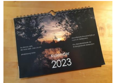
Vorjahreskalender (der neue ist noch nicht gedruckt)

Sie suchen noch ein Weihnachtsgeschenk und wollen zugleich etwas Gutes tun? Wir bieten Ihnen nun zum zweiten Mal einen Kalender mit unseren schönsten jahreszeitlichen Bildern rund um Seckenheim und den Monatssprüchen im DIN A4-Format auf verbindliche Vorbestellung mit Vorkasse bis zum 05.12.2023 an. Der Kalender wird dann noch vor Weihnachten (voraussichtlich 20.12.2023) bei uns eintreffen. Innerhalb Seckenheims können wir Ihnen den Kalender vorbeibringen oder Sie holen ihn persönlich im Pfarrbüro ab.