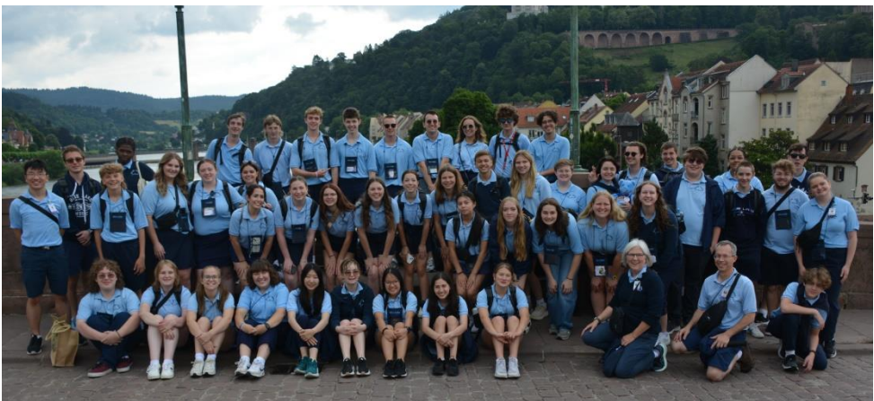
Gruppenfoto auf der Alten Brücke in Heidelberg

Letzten Samstag kamen unsere Gäste aus Michigan USA in Seckenheim an. Die Blue Lake International Symphony Band machte mit 55 Personen Station hier auf ihrer Europatournee.