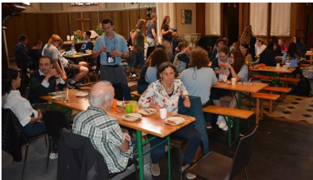
Dienstagabend: Abschiedsessen in der Erlöserkirche