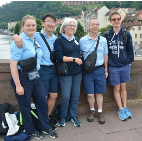
Das BlueLake Leitungsteam

Ganz viele Gastfamilien haben dem Orgateam inzwischen zurückgemeldet, wie toll und wertvoll sie diese Tage erlebt haben, auch wenn sie für alle anstrengend waren. Das Positive überwiegt ganz klar, und wir sind einfach nur dankbar für diese großartige Chance der Begegnung über alle Grenzen hinweg.