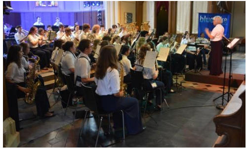
Montagabend: Konzert in der Erlöserkirche

Bei Familienausflügen am Sonntag, Schulbesuchen oder Stadtrundgang durch Mannheim am Montag und auch beim Ausflug nach Heidelberg am Dienstag gab es vielfältige Möglichkeiten zum Kennenlernen und Austausch.