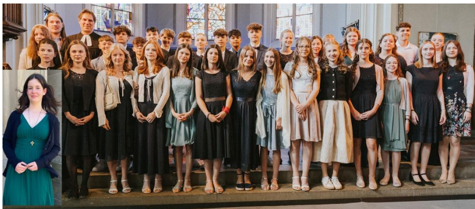
Unser Konfi-Kurs 2024/25 mit Teamern und Teamerinnen am 11. Mai 2025